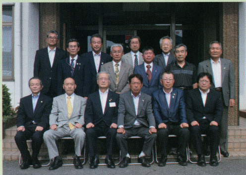
中津川市森林組合新役員