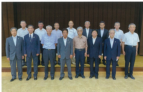
中津川市森林組合新役員